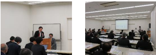
会場風景(栃木県庁研修館4階402研修室)

防災科学技術研究所水・土砂防災研究部門による基調講演は気象災害と被害軽減に向けた取組を解りやすく説明され、興味深く好評でした。さらにシーズ説明から会場にて個別マッチングが8件あり、盛況にて終了しました。